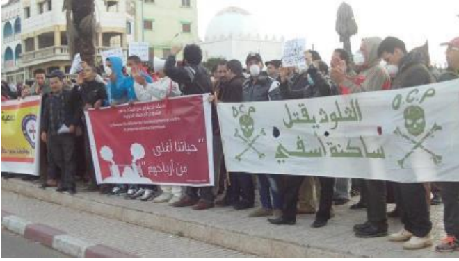
Manifestation en 2014 à Safi contre l'implantation d'une centrale thermique et contre la pollution causée par l'OCP.

En 2014, l'Association Marocaine des Droits de l'Homme, Attac Maroc et des associations de riverains ont organisé une manifestation dans la ville de Safi pour protester contre la construction d'une centrale à charbon à côté du site de l'OCP et contre la pollution causée par l'OCP (voir photo). La manifestation a réuni environ 200 manifestants 68 .