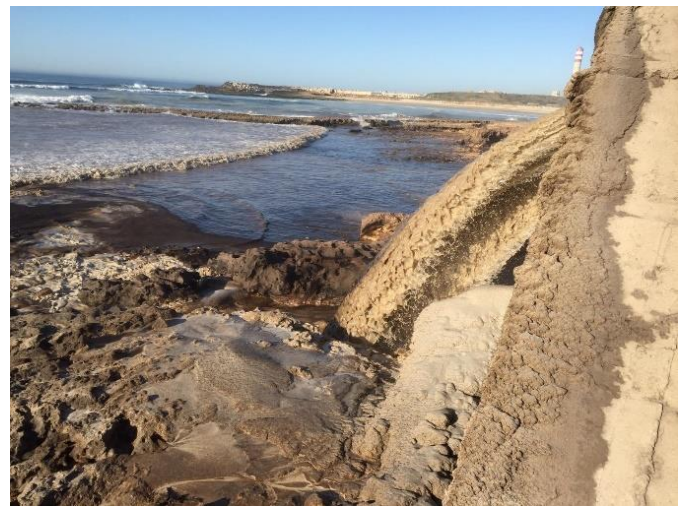
Déversement d'une eau acide et contaminée par l'uranium (février 2019).