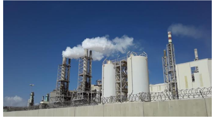
Fumées s'échappant des cheminées du site de l'OCP Safi en février 2019.

Ainsi, la production d'engrais phosphatés engendre de nombreuses pollutions et de nombreux risques pour la santé humaine et animale. Dans le cas de l'OCP, l'enquête démontre des impacts négatifs importants sur la santé des travailleurs et sur les communautés riveraines, ainsi que sur l'environnement (voir chapitres suivants).