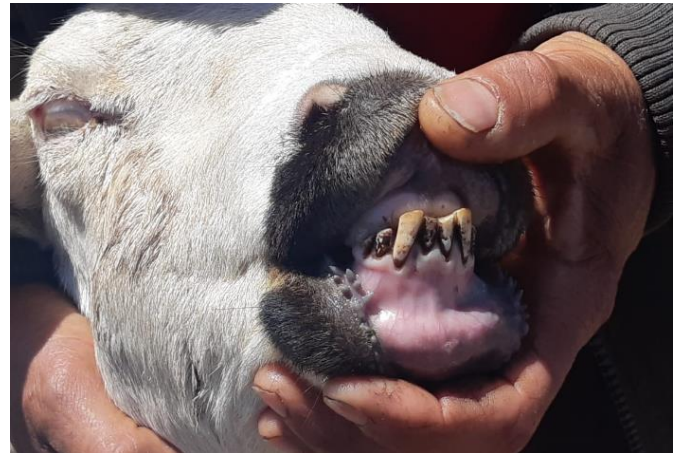
Dents brunes d'un mouton dans un village à proximité de l'OCP Safi (février 2019).

Une ONG locale, l'Association du Littoral pour le Développement, indique que de nombreux agriculteurs autour du site de l'OCP ont déposé des requêtes pour obtenir des compensations pour la pollution. Avant 2010, le tribunal se prononçait en faveur des agriculteurs et obligeait l'OCP à les dédommager pour les dommages subis (terres polluées, animaux malades, arbres desséchés). Depuis 2010, plus aucun agriculteur n'a reçu de compensation, le tribunal arrivant à la conclusion qu'il n'y avait pas de dommages. Les personnes interviewées en 2019 ont affirmé qu'elles considèrent ce revirement du tribunal comme étrange et inexplicable. En effet, les pollutions ne se sont