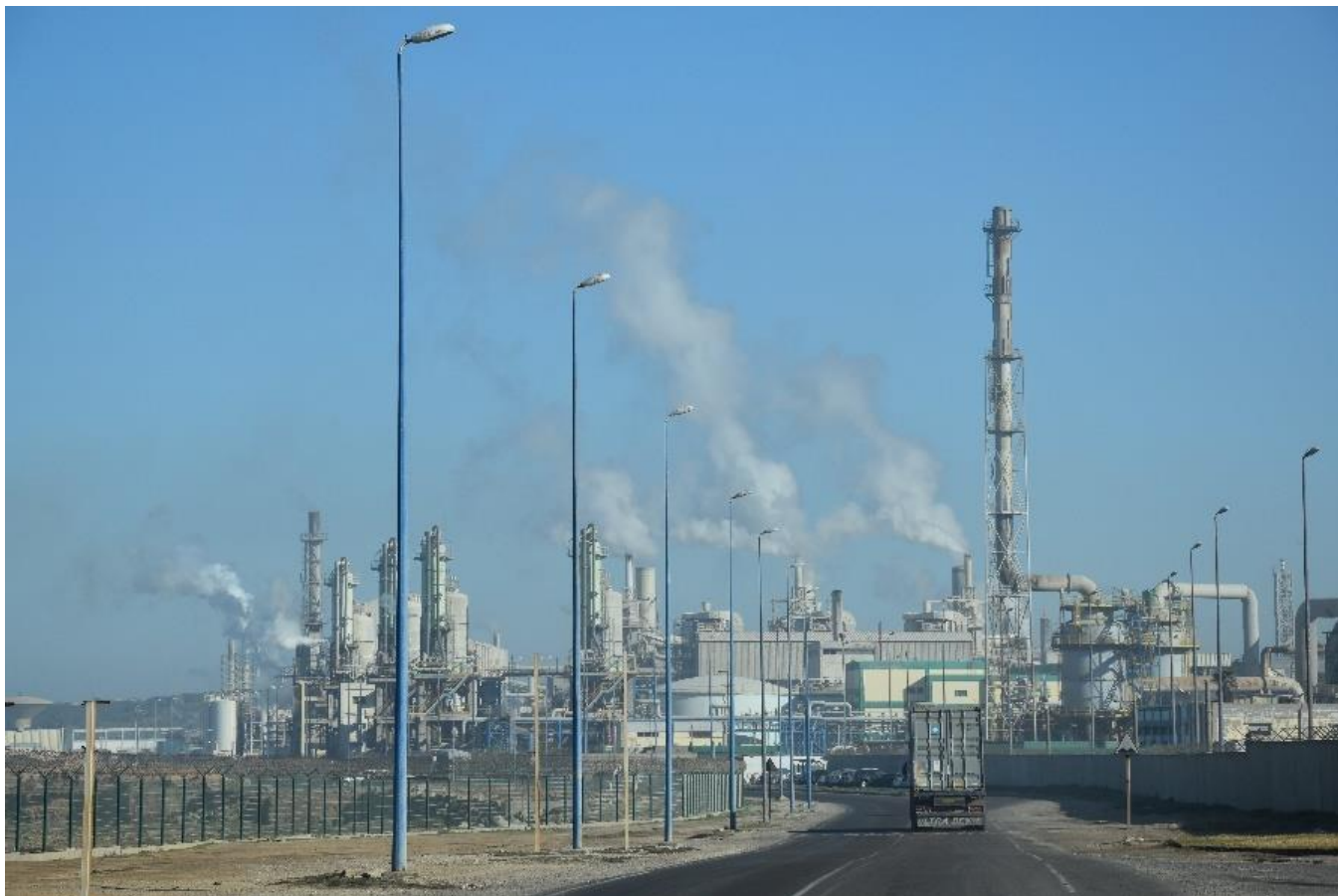
Le site de l'OCP Safi en février 2019 : des fumées toxiques et des poussières fines s'échappent en permanence des cheminées.