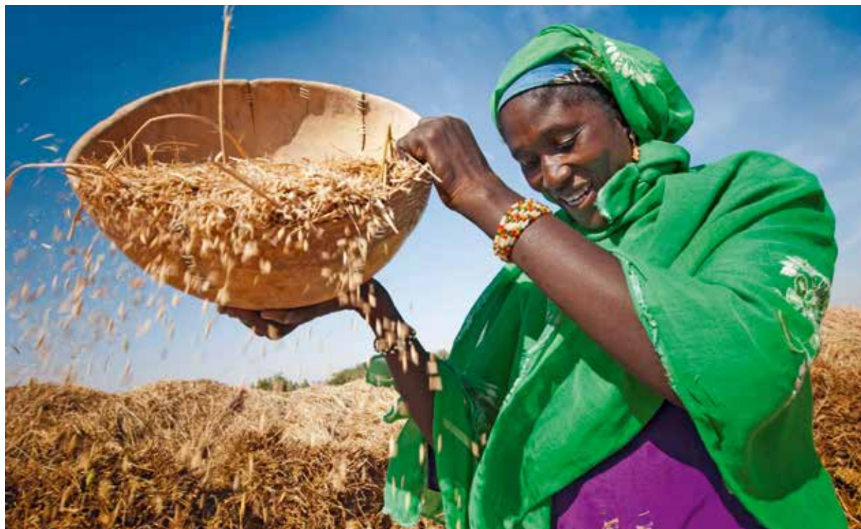
Les paysans et les paysannes se retrouvent toujours plus souvent en marge de la société.