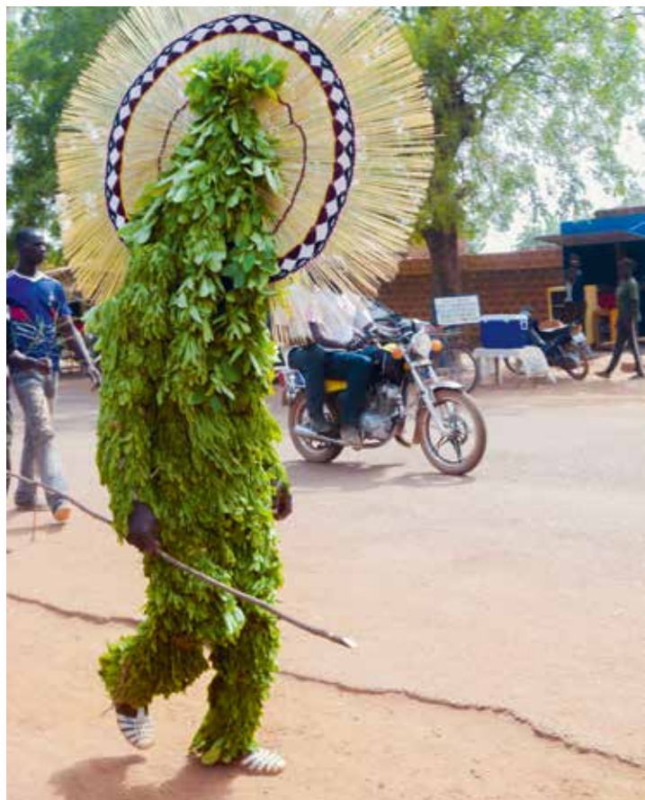
Participant à un festival de masques organisé par Asama.