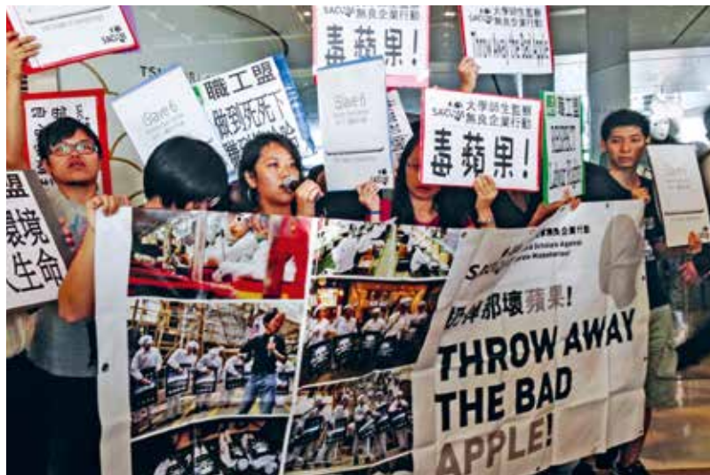
Des militants et militantes de Sacom exigent publiquement qu'Apple améliore les conditions de travail dans les usines de ses sous-traitants.