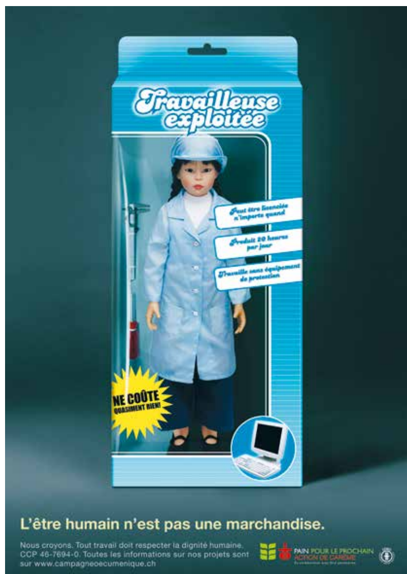
Affiche de la campagne 2007 – toujours d'actualité.

Depuis 2007, Pain pour le prochain et Action de Carême mènent la campagne « High Tech – No Rights ». Celle-ci met en lumière les conditions de travail indignes dans lesquelles sont produits nos appareils électroniques et appelle à agir.